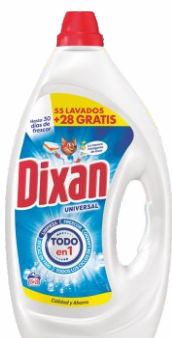
Detergente DIXAN Líquido 55+28 lavados