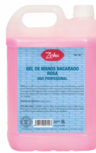
Gel de Manos ZORKA 5 Litros