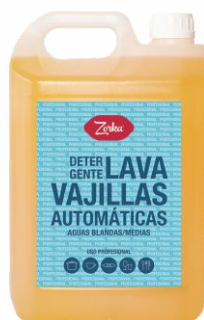
Vajillas ZORKA 6 Kilos