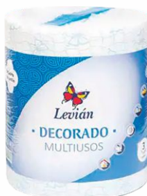
Rollo Papel LEVIAN Multiusos 435 servicios