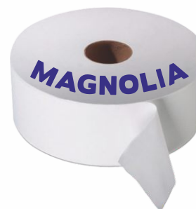
Papel Higiénico MAGNOLIA 2 Hojas, 45mm. 100 metros Pack-12