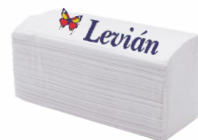
Toallas Tissue LEVIAN 2 Capas (4x200uds.)