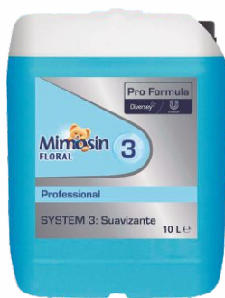
Suavizante MIMOSIN 10 Litros