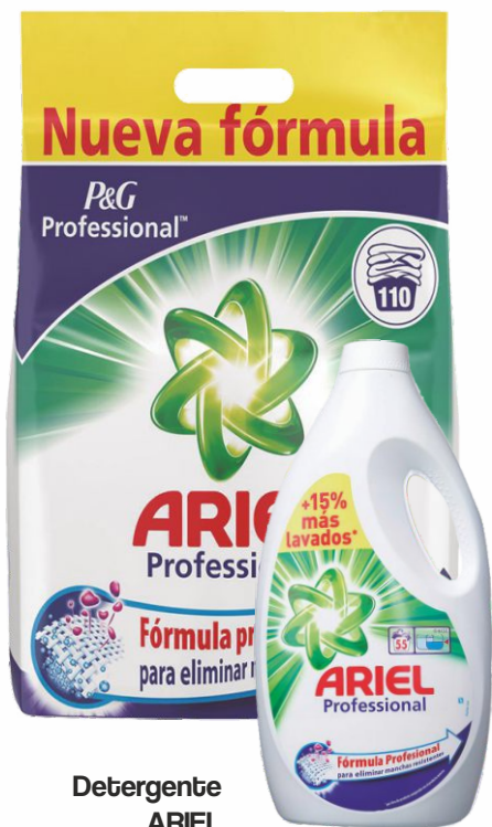
Detergente ARIEL Saco 110 dosis