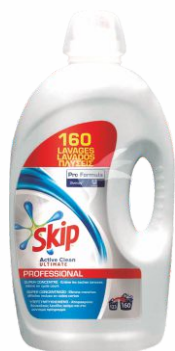
Detergente SKIP Líquido 160 lavados