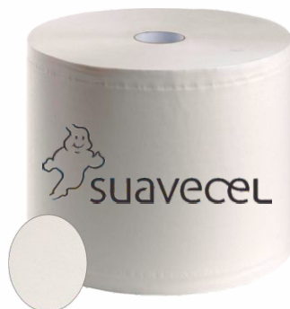
Bobina Secamanos SUAVECEL Gofrado, 100 metros pack-6