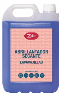
Abrillantador ZORKA 5 Litros