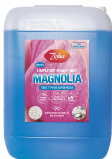
Fregasuelos MAGNOLIA 10 Litros