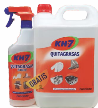
Quitagrasas KH7 +KH-7 Cítrico 5 Litros + 1 Litro