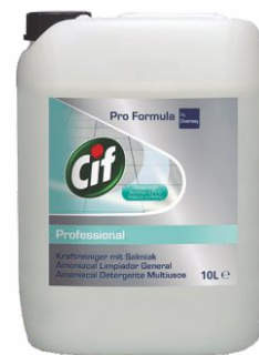
Limpiador CIF 10 Litros