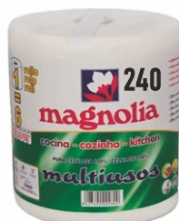
Rollo Papel MAGNOLIA Multiusos 240 servicios