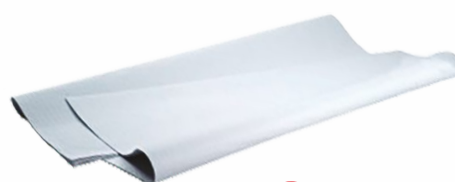
Mantel Rollo BOPAPEL 1+100 metros