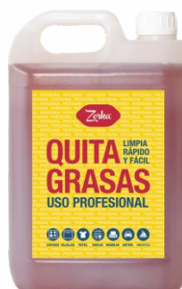
Desengrasante ZORKA 5 Litros