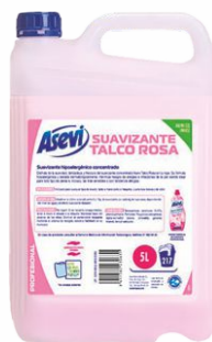
Suavizante ASEVI 5 Litros