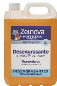
Desengrasante ZELNOVA (Antes ZELCO) 5 Litros