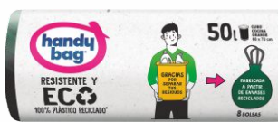
Bolsa Basura HANDY 68x73-50L. (8uds)