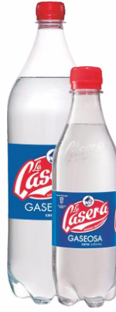
Gaseosa LA CASERA Botella de 1,5 Litros