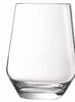
Vaso CARRE 45cl.