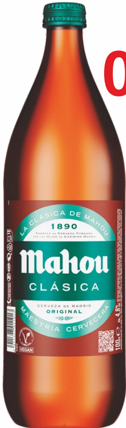
Cerveza MAHOU Botella de 1 Litro