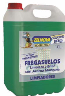
Fregasuelos ZELNOVA 5 Litros