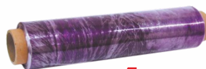
Papel Film CATERING 30x300 metros