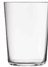
Vaso Tensionado Sidra CADIZ 51cl.