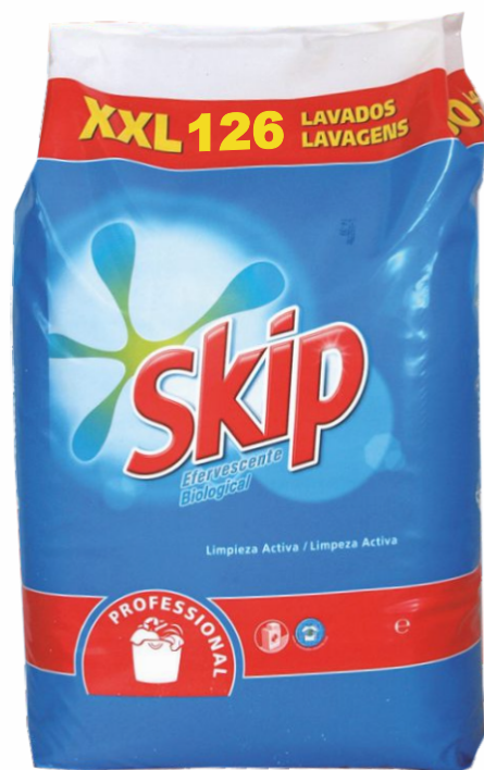
Detergente SKIP Saco 120 dosis