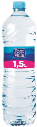
Agua FONT VELLA Botella de 1,5 Litros