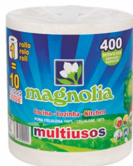
Papel Multiusos MAGNOLIA 400 servicios