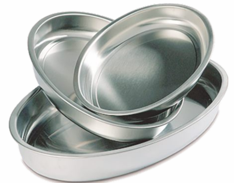
Fuente Honda INOX 35cm.