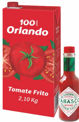
Tomate Frito ORLANDO 2,10 Kilos