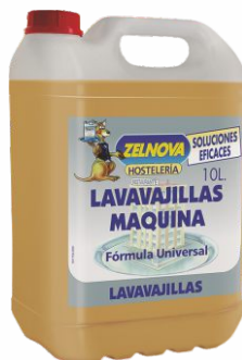
Vajillas ZELNOVA 5 Litros