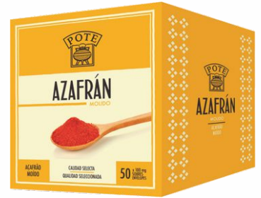
Azafrán Puro Molido POTE 50 sobre x 100mg.