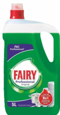
Vajillas FAIRY 5 Litros