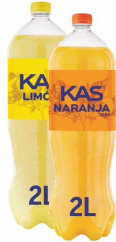
Refresco Naranja ó Limón KAS Botella de 2 Litros