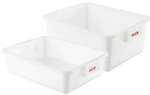
Cubeta ARAVEN nº1-3L.