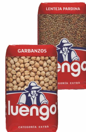
Lentejas Pardina ó Garbanzos Mejicanos LUENGO paquete de 1 Kilo