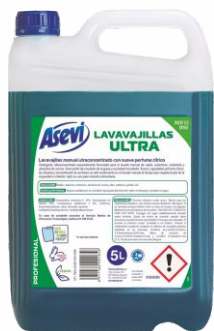
Vajillas ASEVI 5 Litros