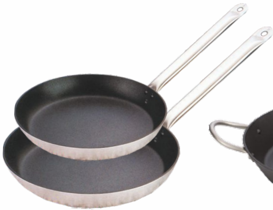
Sartén LACOR 24cm.