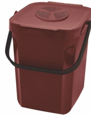
Pedalbin Color METAL BLANCO 26L.