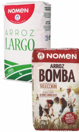
Arroz Largo NOMEN 1 Kilo