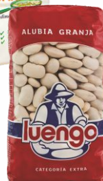
Alubia Granja LUENGO Paquete de 500g.