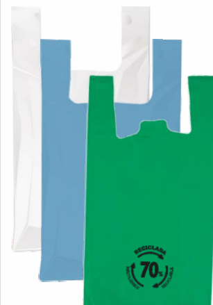
Bolsa BLANCA 40x50