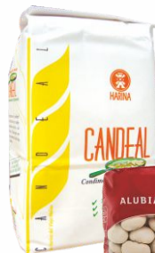
Harina CANDEAL Paquete de 1 Kilo