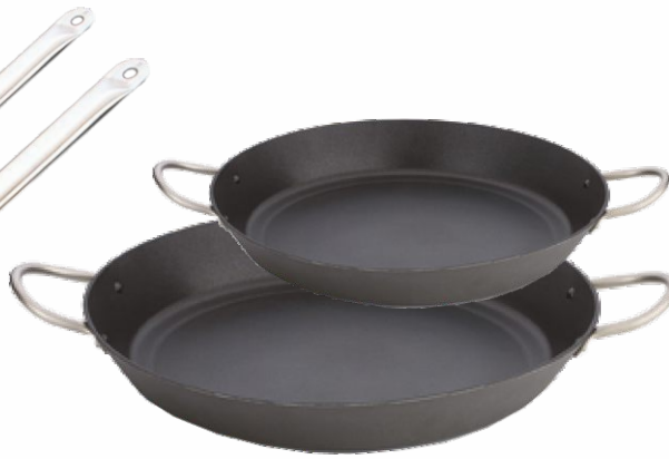
Sartén LACOR 36cm.