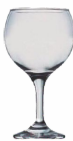
Copa BISTRO 63cl.