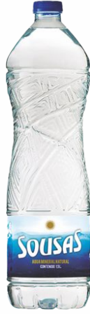
Agua SOUSAS Botella de 1,5 Litros