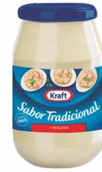
Mayonesa KRAFT 490ml.