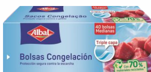
Bolsa Congelación ALBAL Mediana 3L.