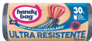
Bolsa Basura HANDY 55x63-30L. (12uds)