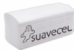
Toallas Tissue SUAVECEL 2 Capas (20x200uds.)