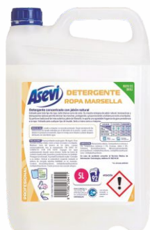
Detergente ASEVI 5 Litros