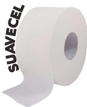
Papel Higiénico SUAVECEL 2 Hojas, 60mm. 120mt.-P12