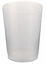
Vaso Sidra IRROMPIBLE 600ml.