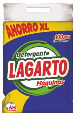
Detergente LAGARTO 125 lavados 10Kg.