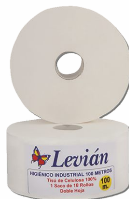
Papel Higiénico LEVIÁN 2 Hojas, 45mm. 100mt. P18