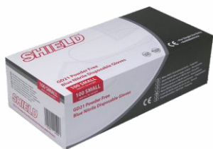
Guantes SANTEX Azul Nitrilo 100uds.