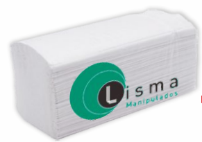
Toallas Tissue LISMA 2 Capas (20x200uds.)