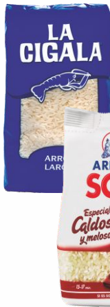
Arroz LA CIGALA Largo1 Kilo