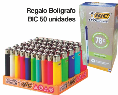
Regalo Bolígrafo BIC 50 unidades